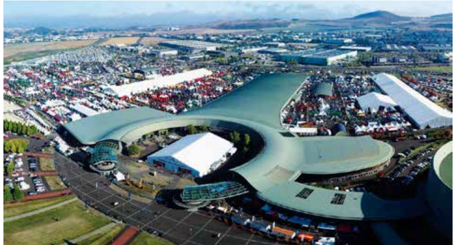
La visita al Sommet d'élevage a Clermont-Ferrand è uno dei momenti salienti del viaggio.

Condizioni: passaporto/carta d'identità validi, minimo 20 partecipanti, limite massimo (considerazione in base all'ordine di arrivo delle iscrizioni).