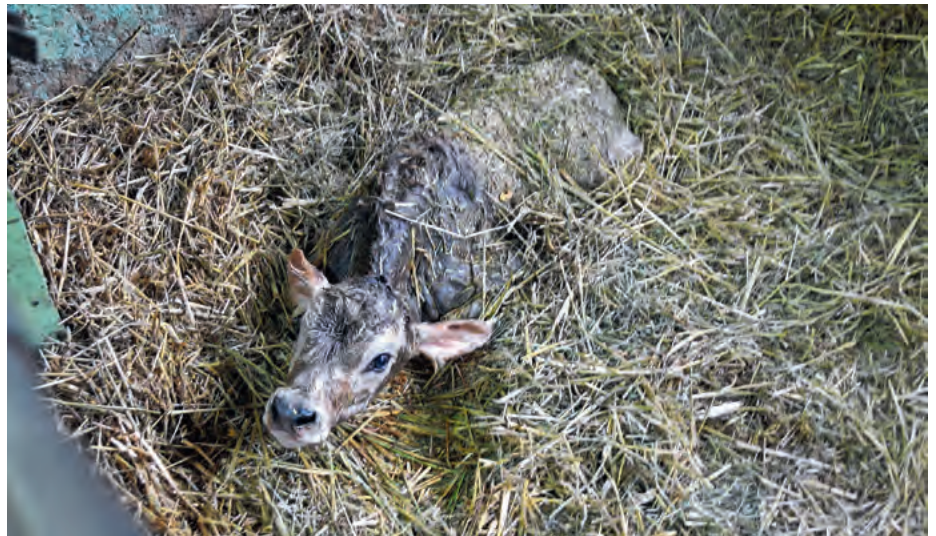
Die Nachkommen von Stieren mit hohem Zuchtwert haben eine deutlich tiefere Totgeburtenrate.

Um die berechneten Zuchtwerte zu überprüfen, wurde ein sogenannter Top-Bottom-Vergleich gemacht. Das heisst, es wurden jeweils die Stiere mit den 10 % höchsten (top) und den 10 % tiefsten (bottom) Zuchtwerten ausgewählt. Anhand der Geburtsmeldungen der Nachkommen dieser Stiere wurden die Anteile Normal- bzw. Lebendgeburten für die Top- bzw. Bottom-Stiere berechnet. In den Abbildungen 1 und 2 wird dieser Zusammenhang zwischen dem Zuchtwert des Vaters und den Geburtsinformationen der Nachkommen für die Zuchtichtung Brown Swiss grafisch dargestellt. Die Abbildungen bestätigen die Erwartung,