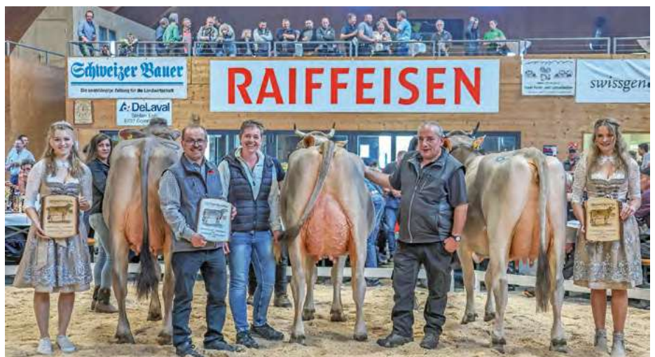
Mit einem Züchter-Inserat im CHbraunvieh kann Ihre Viehschau national beworben werden und erfährt eine hohe Beachtung. Das Preis-Leistungs-Verhältnis ist sehr reizvoll und interessant, testen Sie uns!