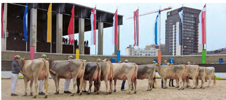
Qualité exceptionnelle de la race Brune lors de l'élection des championnes de l'année dernière.

La traditionnelle vente aux enchères de la Brune à mi-parcours de l'OLMA est également connue pour sa bonne qualité. Les éleveuses et éleveurs qui souhaitent encore compléter leur cheptel avec un animal de première qualité ont une bonne occasion de le faire. ■