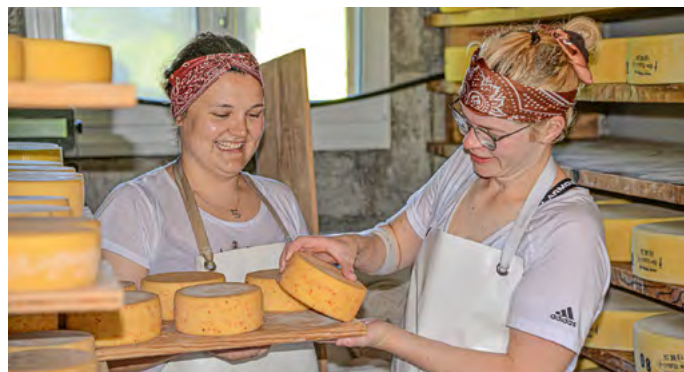
Le personnel de l'alpage fabrique avec grand soin le meilleur fromage d'alpage.

qui la vache OB, facile à vivre, a également une grande importance.