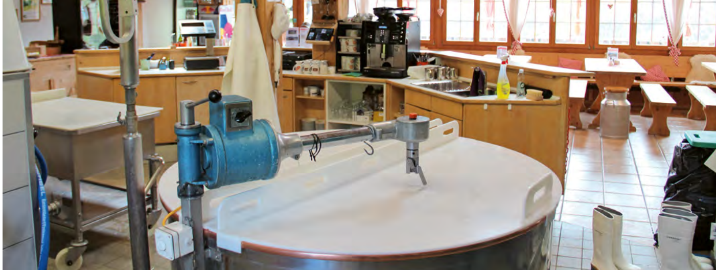
Fromagerie de démonstration avec buvette d'alpage.