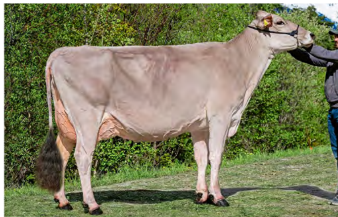
Salomon Lara EX90 Ø2 lact. 9762, 3.39 % MG, 3.30 % prot., CELL 32; 1 er rang Agrischa 2024.