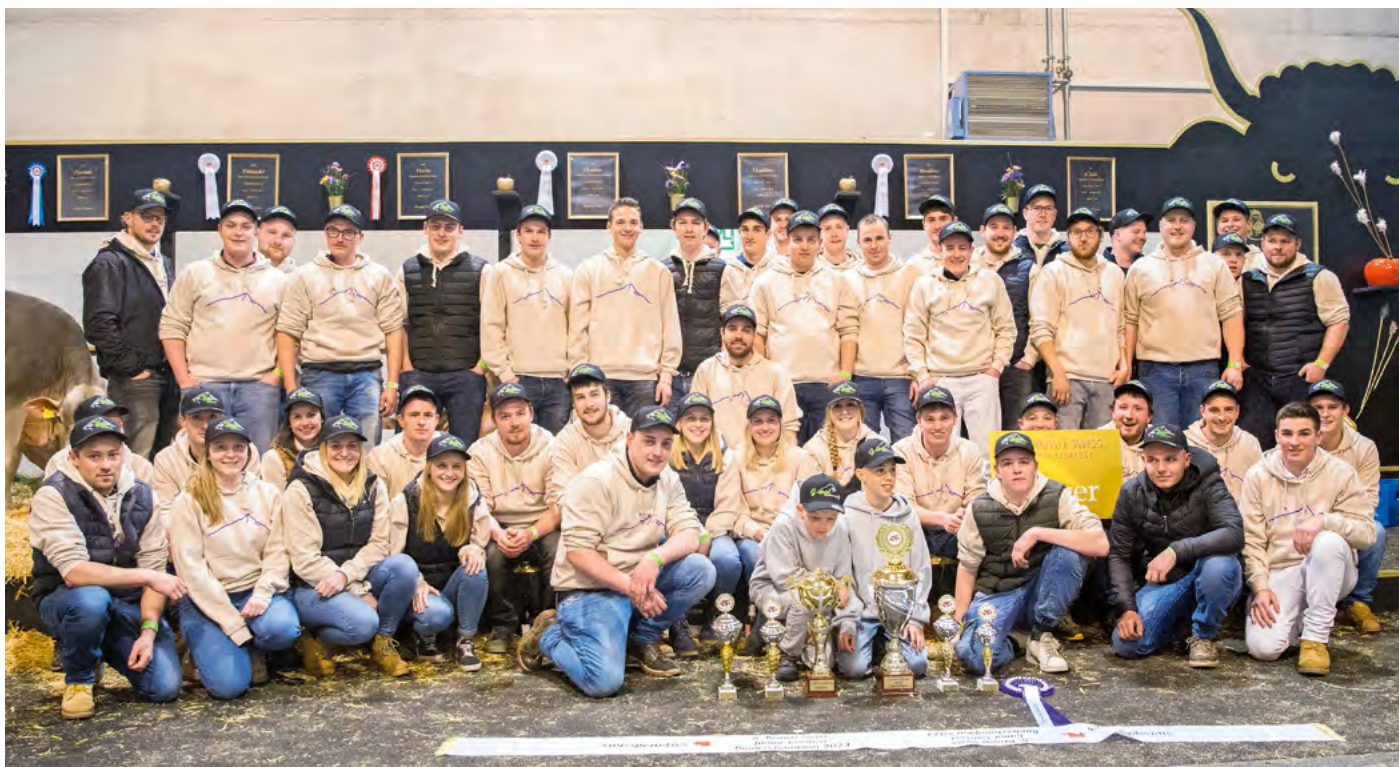
L'association des jeunes éleveurs du canton d'Uri, couronnée de succès, à l'occasion du BSJC 2023.

COMITÉ DIRECTEUR DE L'ASSOCIATION URANAISE DES JEUNES ÉLEVEURS