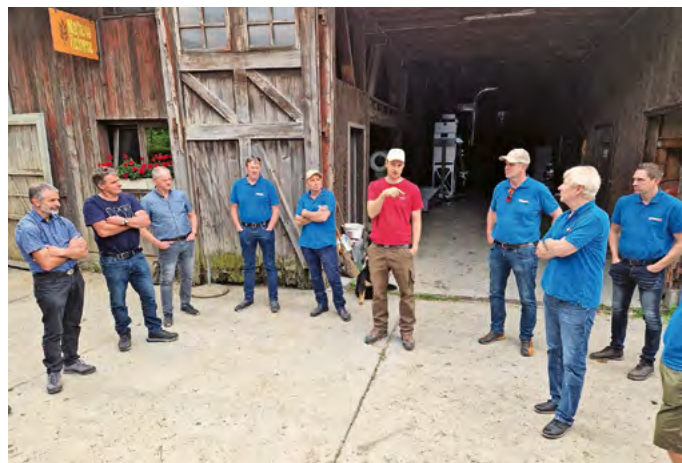
Visite de la Masseria Ramello, Cadenazzo, à l'occasion de la séance d'été du comité au Tessin.