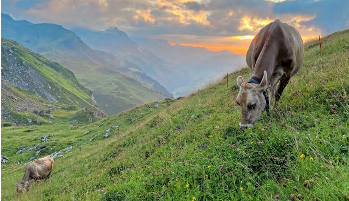
Bächeler's Phil Phylis EX93 avec une magnifique décor.