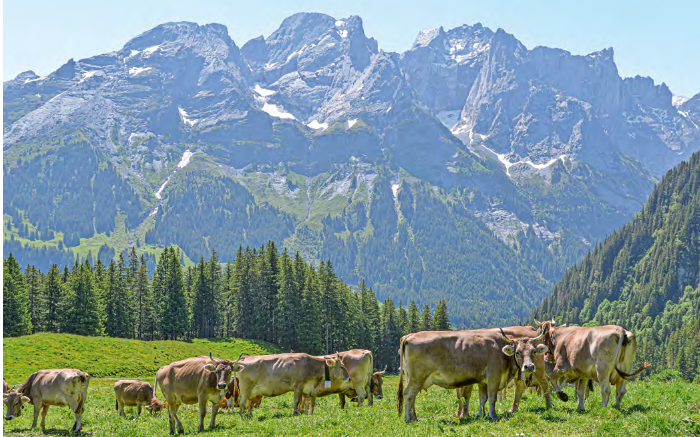
Alpes avec une vue magnifique sur les montagnes Engelhörner.