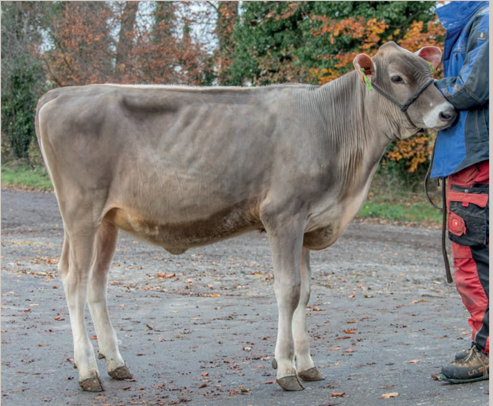
Leon-ET PP LOANA-ET