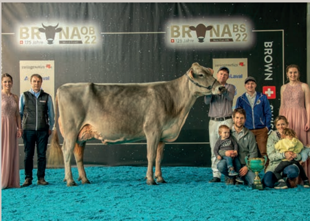
Grossmutter Duss BS Biver HAPPY-ET