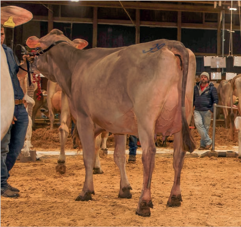
Lanker's Aldo Sg PANDORA