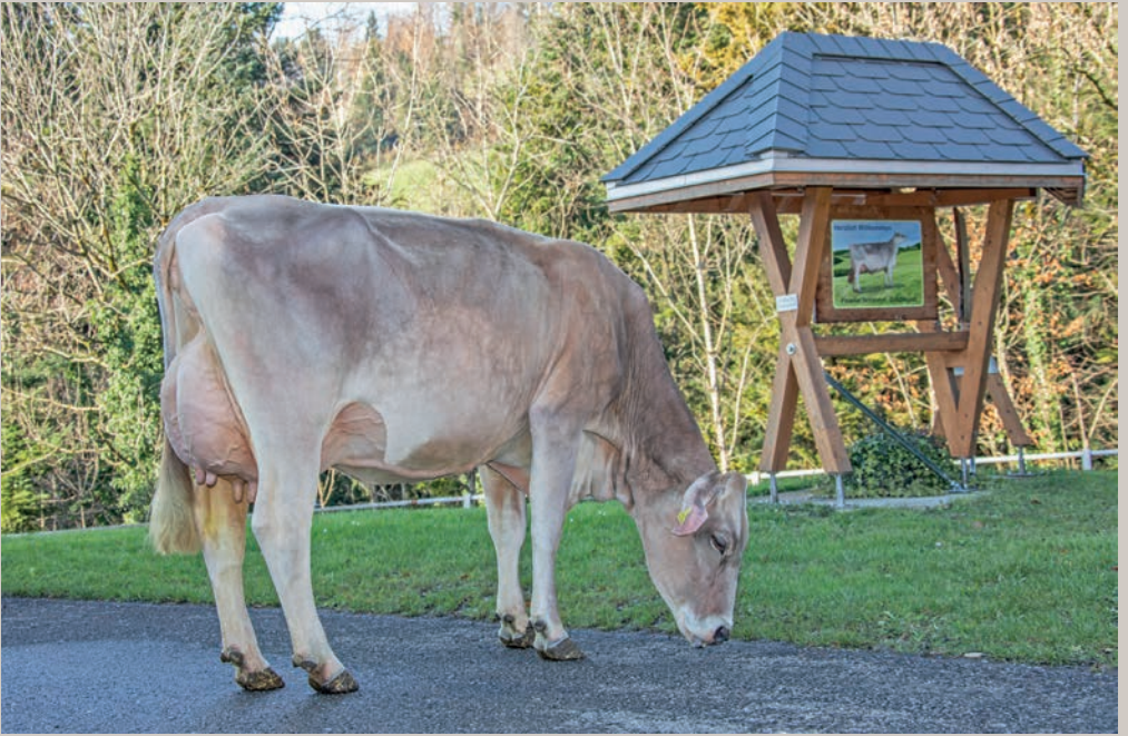
Schirmer's Barca BALAIKA