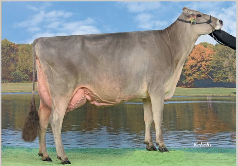
Eloise ist aus der Linie von Jongleur Elisa