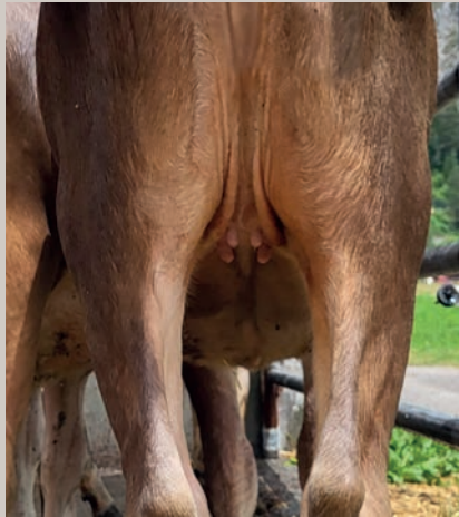
Mutter Telli's Dreamer PESETA