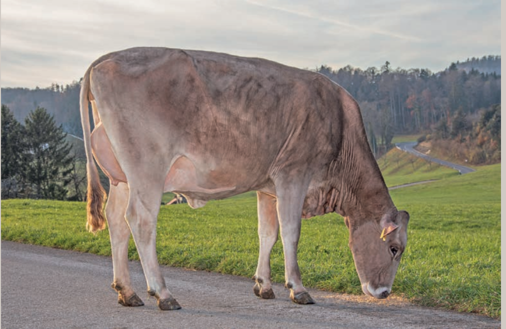
Büsser's Aldo Sg GURTNELLEN