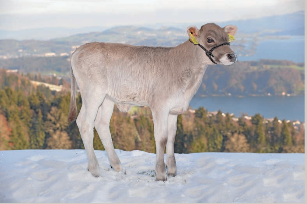
ZROTZ BS Brice VENICE-ET