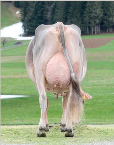
Grossmutter Felder's BS Biver BEYONCE