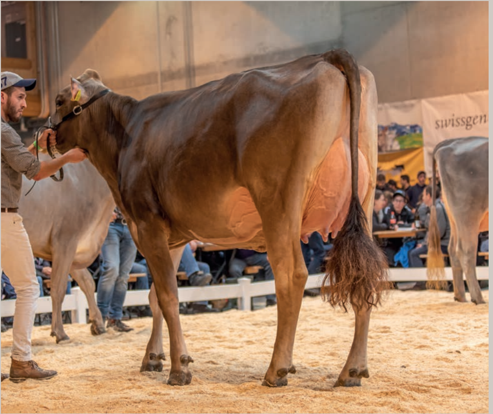
Grossmutter Telli's Pete PIPPER