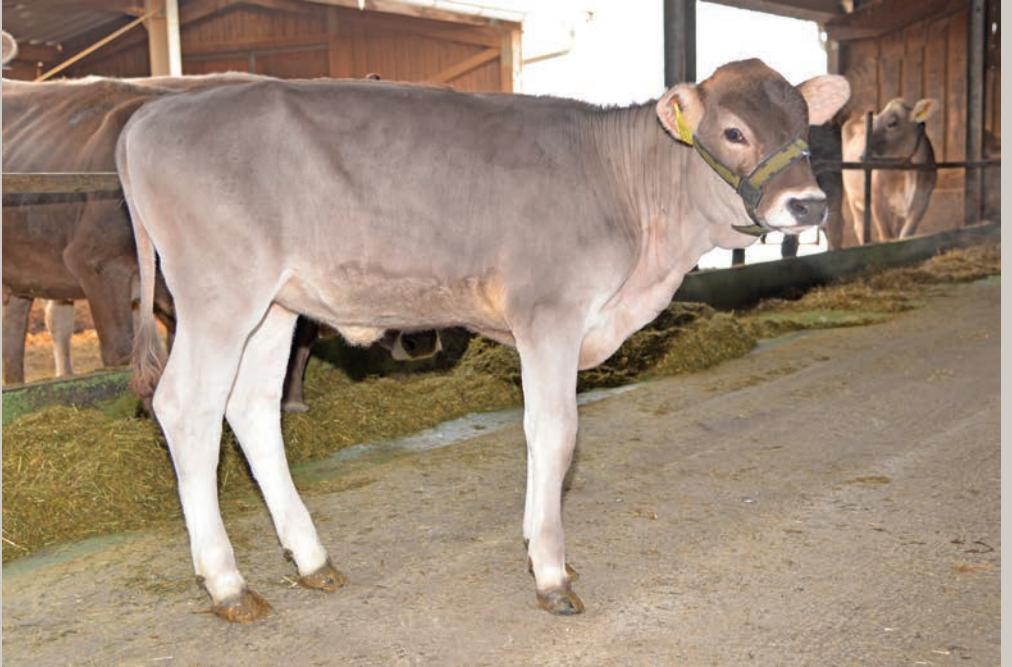
Travel Farm Biniam ROSSANA