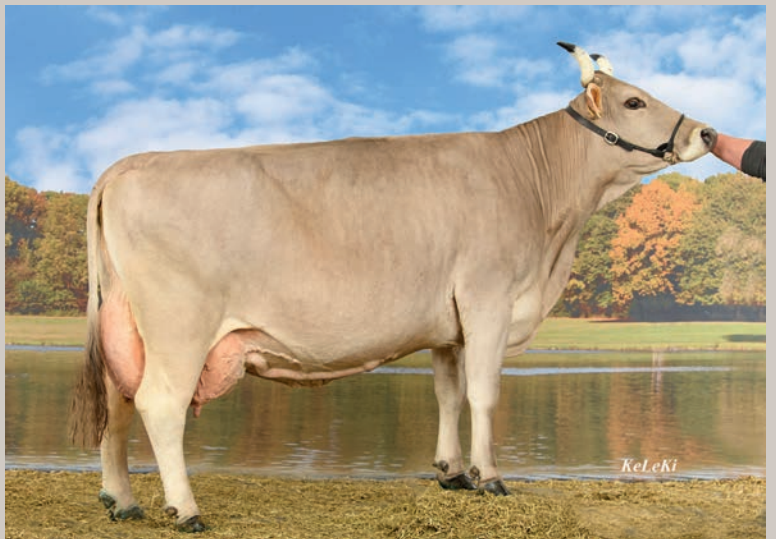
Grossmutter Rino ORIGINALA