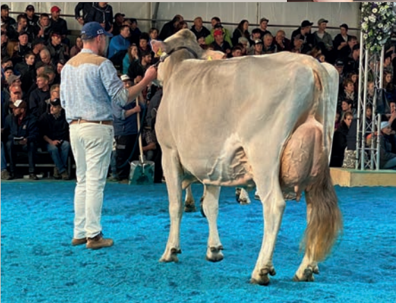
Mutter ZROTZ Blooming VITA