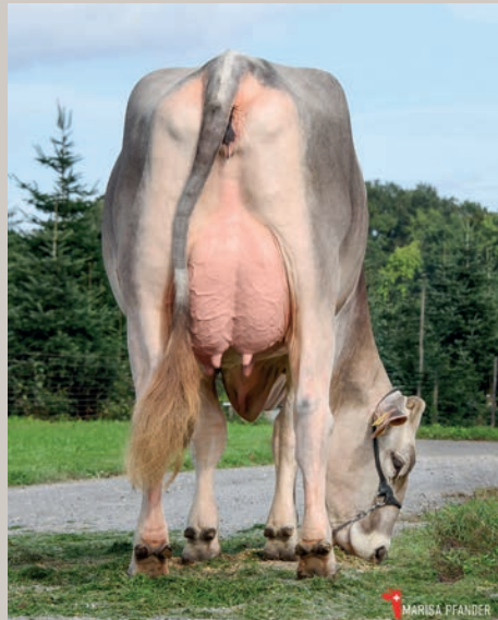
Grossmutter GoldHill Boss CARINA SG-ET