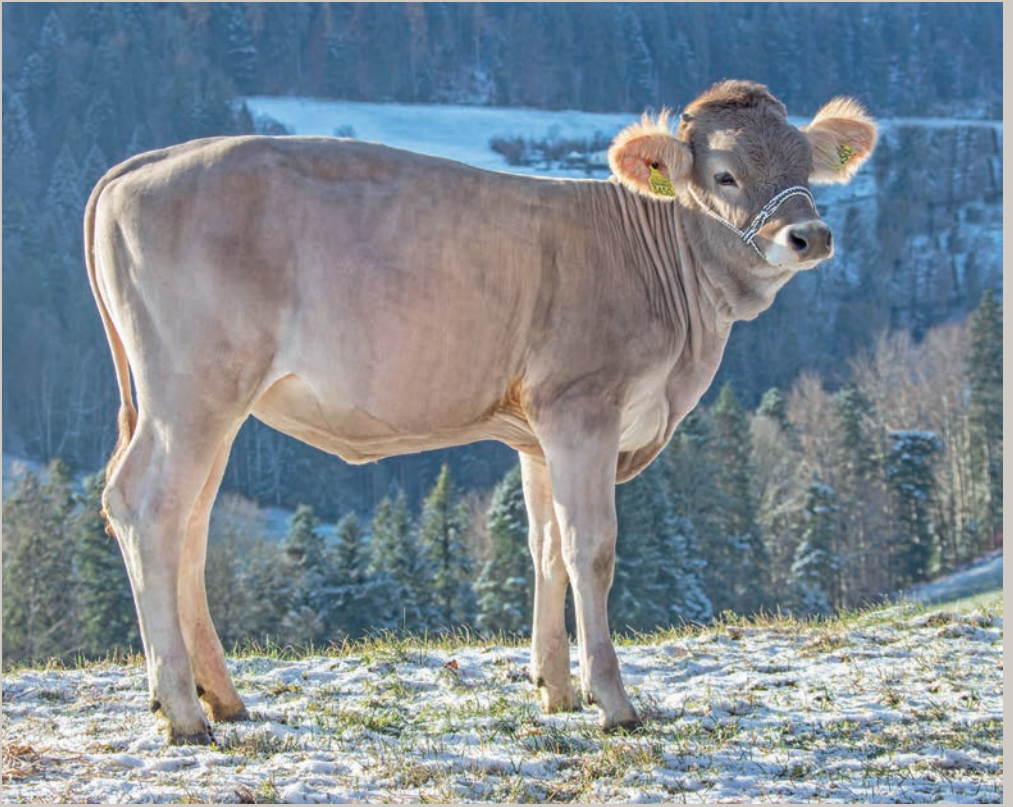
Mächler's OB Arcas STINA