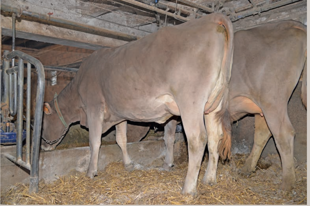
Castelli BS Brice SALLY