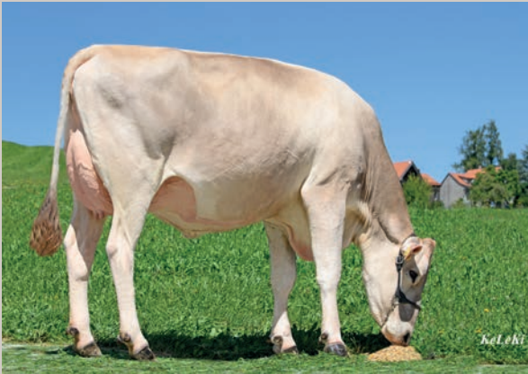
Mutter Lanker's Lennox PRINCESS