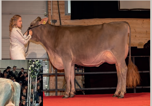
Vollschwester ZROTZ Brice VERA