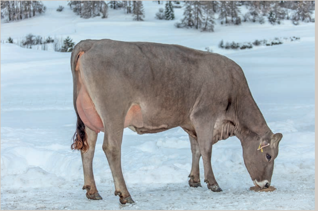
Cadalbert's Brigant PHLOX