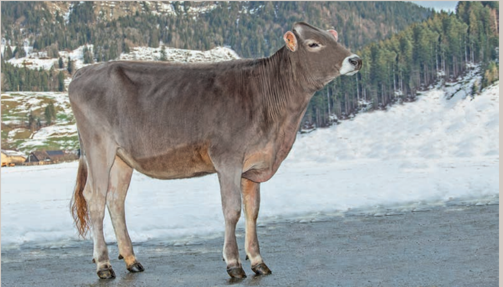
Felder's BS Biniam *JOYCE*