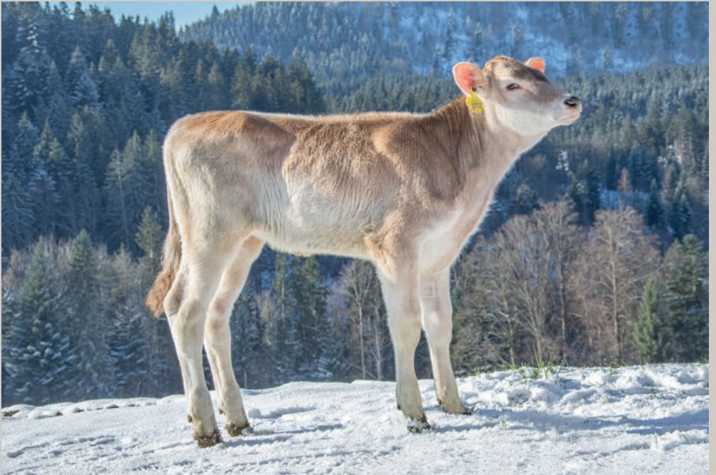
Schatt's Adee ANNINA