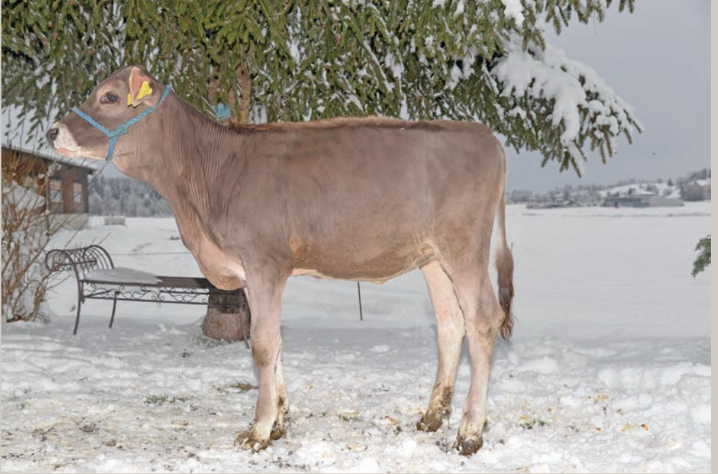
Castelli BS Caviezel WANDA