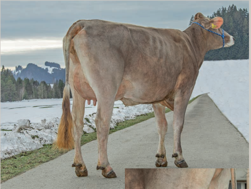
Duss BS 0 Malley LIORA-ET