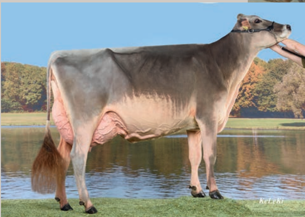
Grossmutter Duss BS Vigor CHERIE