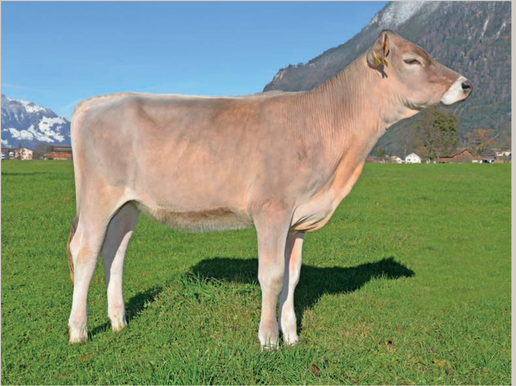
AKA Jinxer NURA-ET