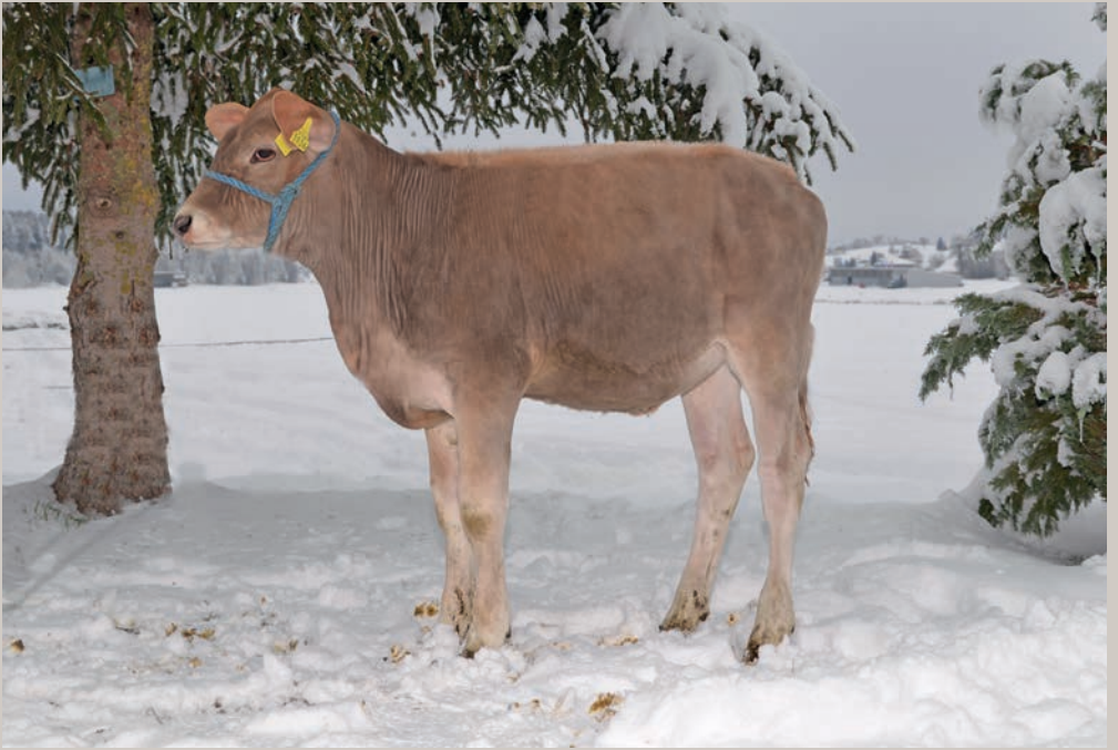
Castelli BS Juri ELDISE