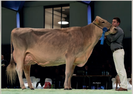
Urgrossmutter TSCHUDENHAUS Big Boy POLLY