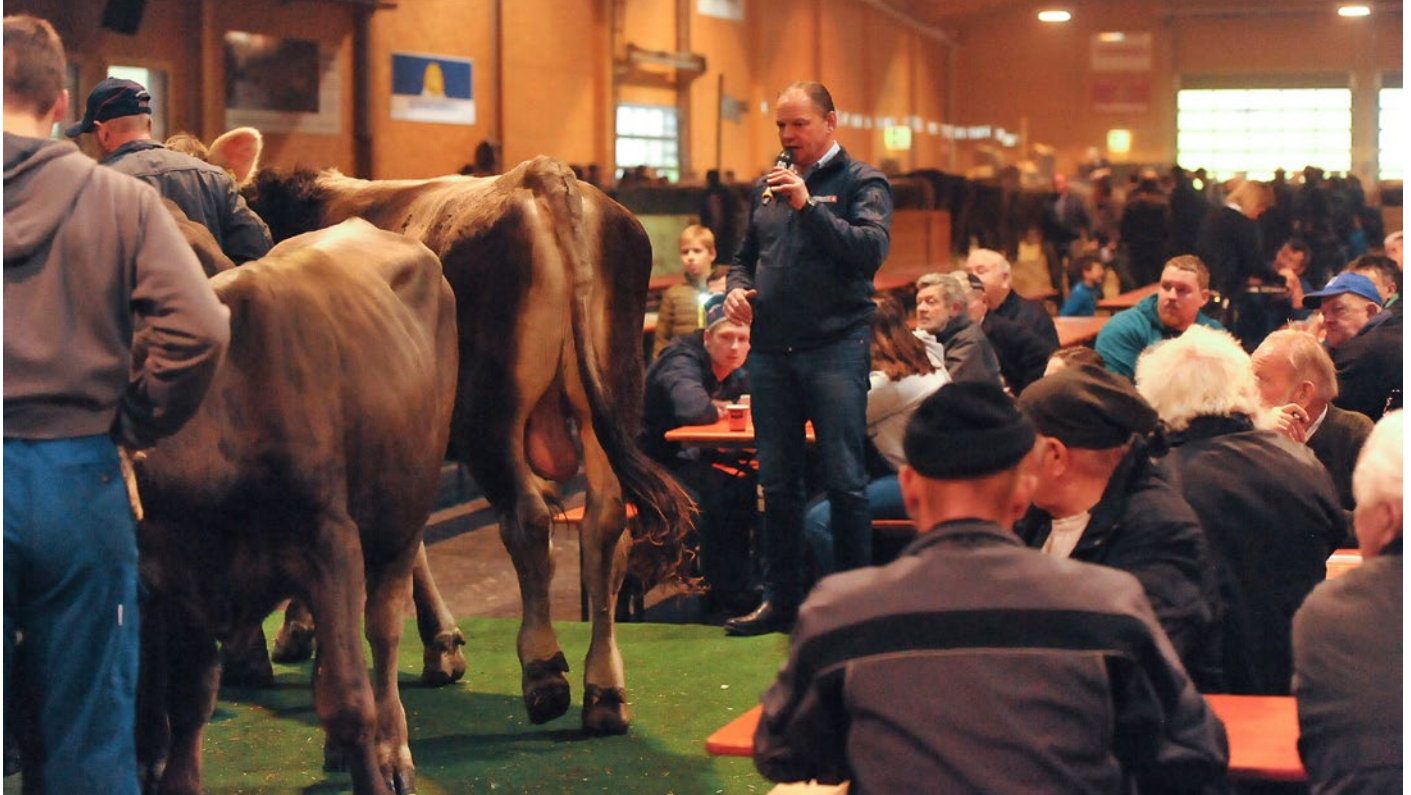
Die Stiere werden auf der Bühne öffentlich rangiert und kommentiert.