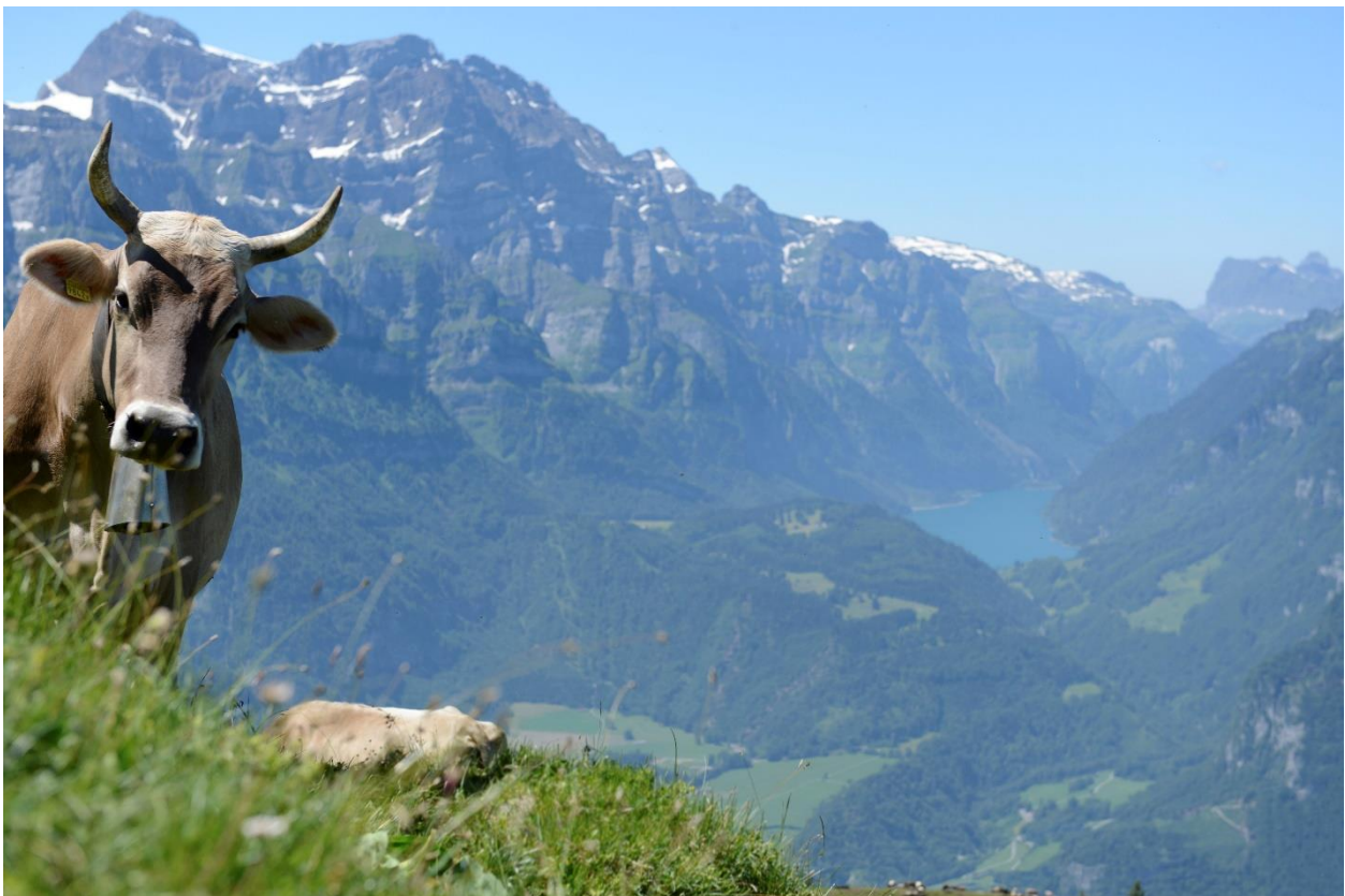
Kühe auf der Fronalp im Kanton Glarus.

Nichterdebuchbetriebe, die einzelne Dienstleistungen von Braunvieh Schweiz beziehen möchten, aber nicht in eines der vorher genannten Programme einsteigen wollen, melden sich bei Braunvieh Schweiz.