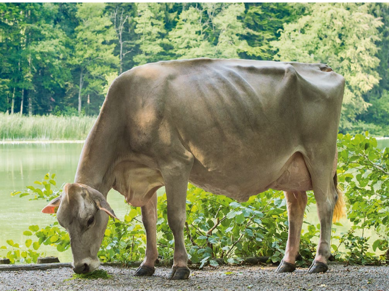
Kaderli's Glenn GWENDY, CH 120.0861.0617.4, geb. 19.1.10, Kaderli Brown Swiss, Götighofen TG LL 55936 kg Milch; Ø 5 Lakt. 8724 kg Milch, 4.20 % Fett, 4.20 % Eiweiss